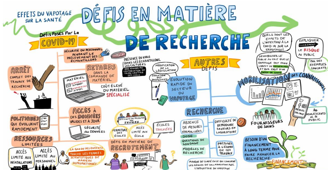
Figure 1 Enregistrement graphique: Défis et stratégies d'atténuation

On a également discuté de défis qui ne concernaient pas la COVID-19, notamment la nécessité : 1) d'une mobilisation accrue des connaissances visant à faire comprendre clairement au public les risques associés au vapotage et 2) d'un financement durable pour appuyer la recherche sur le vapotage. En outre, les participants ont discuté de défis propres à la recherche sur le vapotage, notamment : 1) le manque de mesures normalisées et d'outils de collecte de données (p. ex. questions de sondage); 2) la diversité des modèles de recherche biomédicale; 3) la reproductibilité des systèmes de délivrance de produits de vapotage en phase préclinique. Les préjugés associés à la recherche sur le vapotage créaient aussi des difficultés pour les équipes dans des domaines tels que le financement et le recrutement. Enfin, les changements rapides dans l'industrie des produits de vapotage étaient également source de problèmes en raison de l'évolution des types de dispositifs et des saveurs offertes, ainsi que des défis technologiques liés aux résistances, aux mèches et aux atomiseurs de vapotage. Voir la Figure 1 pour l'enregistrement graphique de Fuselight Creative .